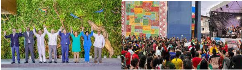
Reunión de presidentes con los indios como invitados de piedra.

Se propuso fortalecer la OTCA – designando posteriormente como responsable al antropólogo colombiano Martin von Hildebrand 3 - y promover mayor participación de organizaciones de base. Pero los acuerdos trasuntan una fuerte fragilidad de políticas, generalmente contradictorias para encarar los delitos ambientales, en donde el enfoque de Seguridad Nacional (guerra, policías, militares y fiscales), resulta contrario al Bioma y sus gentes.