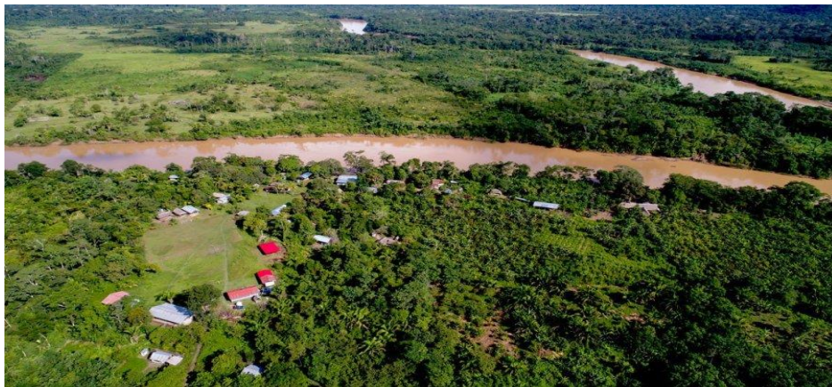
Comunidad Nativa Boca Pariamanu en Madre de Dios, desde el aire 2024