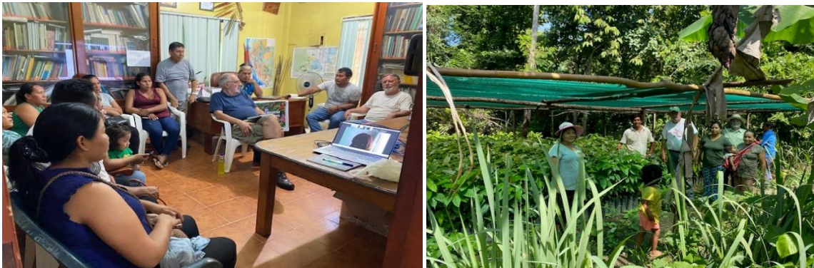
Reunión con la FANAMAD en Puerto Maldonado y visita al vivero de cacao en Boca Pariamanu en marzo 2024

¿Difícil en el corto plazo? ¡¡Claro que SI ... pero ya es el tiempo de hacerlo si queremos sobrevivir!!